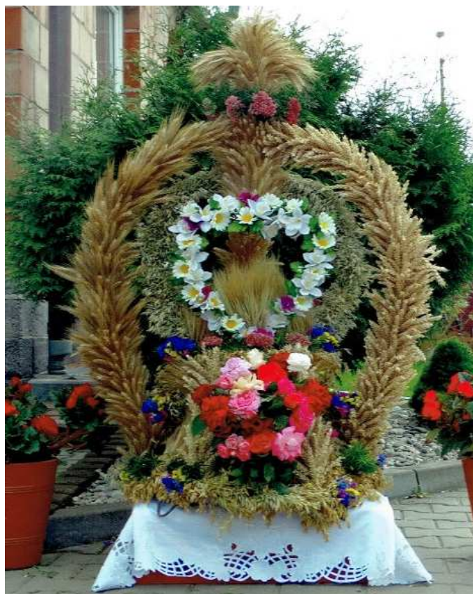
Zdjęcie wienca dożynkowego wykonanego przez Koło Gospodyń Wiejskich w Nieszkowie