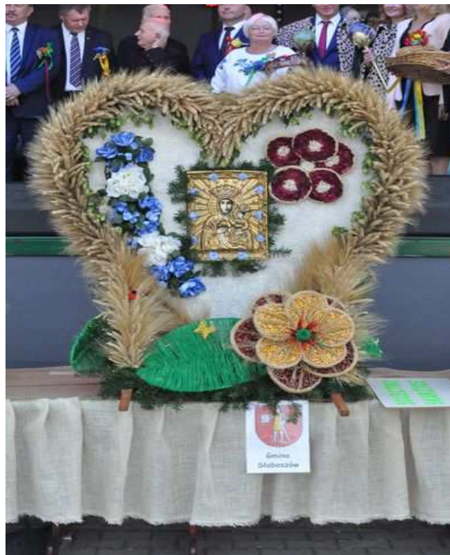
Zdjęcie wienca dożynkowego wykonanego przez Koło Gospodyń Wiejskich w Kalinie Wielkiej