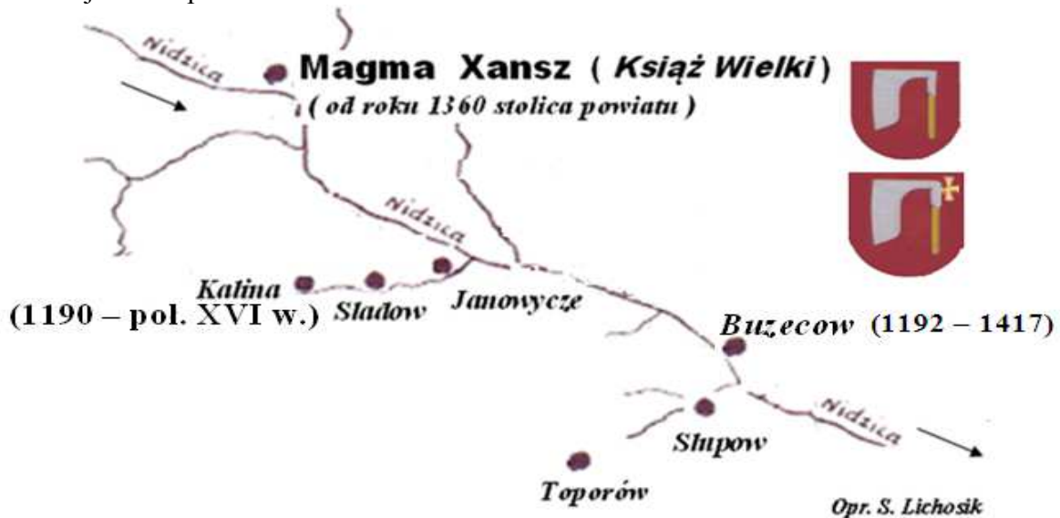
Ryc. 1. Posiadłości Pałuków – Toporów w ziemi słaboszowskiej w okresie średniowiecza.

Lecz zanim do tego doszło ziemie nad Nidzicą i Kalinką przeszły drogą nadania księcia Kazimierza Sprawiedliwego do rycerzy wielkopolskich z Pałuk, tj. z pogranicza Wielkiej Polski i Kujaw. Było to około roku 1190. Ród Pałuków w XII wieku zaliczał się do elity intelektualnej ówczesnej Wielkopolski.