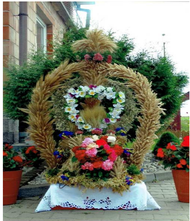
Wieniec dożynkowy Koła Gospodyń Wiejskich w Nieszkowie