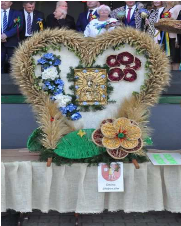
Wieniec dożynkowy Koła Gospodyń Wiejskich w Kalinie Wielkiej

W dniu 17.09.2015 roku zostały zgłoszone do konkursu na wyjątkowy wieniec fotografie dwóch wieńców Kół Gospodyń Wiejskich z Nieszkowa oraz Kaliny Wielkiej. W ramach konkursu KGW mają szansę wygrania wycieczki do Rzymu oraz nagrody pieniężnej. Organizatorem jest Redakcja „mojeKGW”. Poniżej zdjęcia przedstawiające przepiękne wieńce dożynkowe.