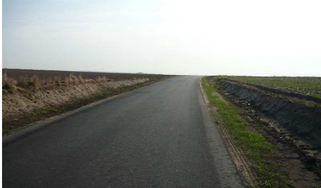
Przebudowana droga gminna na odcinku Maciejów Nowy – Świącice

Kwota zadania wyniosła 312187,14 zł. Zadanie wykonano w całości ze środków własnych budżetu.