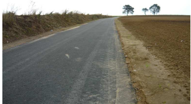
Przebudowana droga dojazdowa do gruntów rolnych w Kropidle